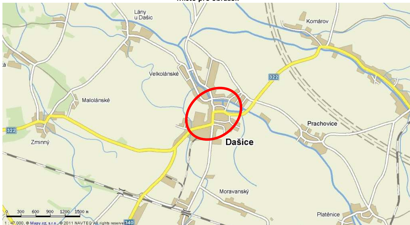
Místo pro obrázek

Tento dokument je považován ve smyslu příslušných ustanovení Obchodního zákoníku v platném znění za obchodní tajemství Manifold Group s.r.o.